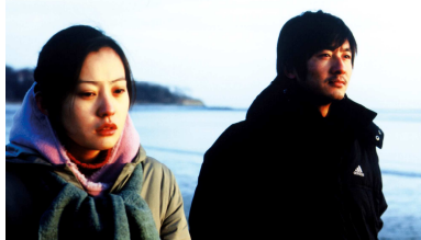
Regisseur: Lou Ye